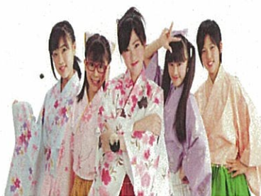
みこ かしま未来ーな

元気な鹿嶋を全 国にPRする為 に結成された5人 組の鹿嶋市のご 当地アイドルです。