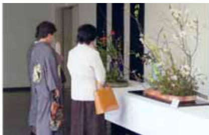
文化フェスティバル