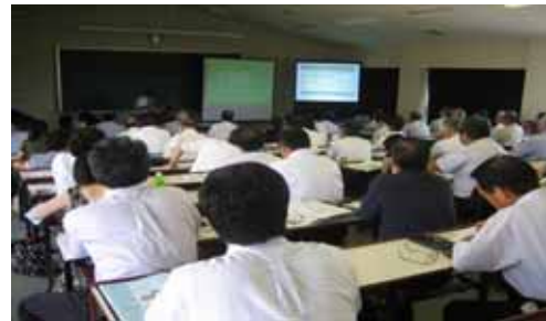
シンポジウム風景

[問] 鹿嶋市まちづくり市民センター内 茨城大学地域総合研究所 鹿嶋研究センター TEL 0299(83)1551(内線21) FAX 0299(83)1553 E-mail collabo3@sopia.or.jp