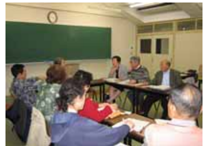
美しいまち専門部会議

当専門部活動がきっかけとなり、市民・事業者・行政が協働で環境問題に効果的に取り組むための組織として「かしま環境ネットワーク」を本年4月に設立しました。また、鹿嶋市まちづくり市民センター内に同ネットワークの活動室をオープンしました。環境に関する展示や書籍・DVD等が閲覧できる活動室は、毎週金～日曜日の午前10時から午後4時の間、開設されていますので、お気軽にお立ち寄りください。