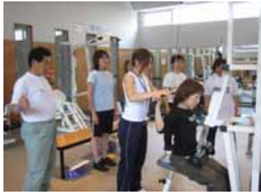
はじめてのトレーニングマシン無料体験

鹿嶋市まちづくり市民懇話会（委員数50名）は、さまざまな市民活動を直接・間接的に支援する「中間支援組織」としての役割を目指し、市民が取り組めるまちづくりについて自由に考え、実践したり、行政への提言を取りまとめるなどの活動を展開しています。今回は、5つの専門部活動の近況について紹介します。