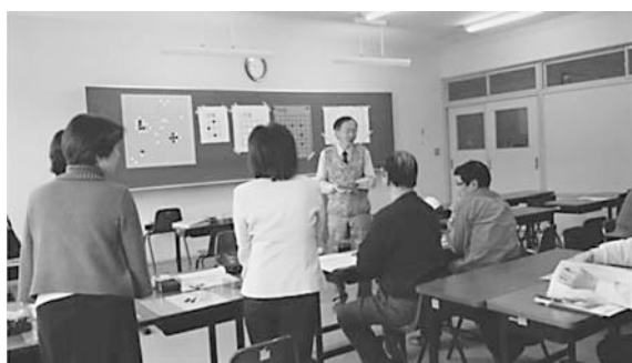
▲ 黒板の碁盤から実践力を学ぶ

実は私、知らないんです。子どもの頃、大人が楽しそうに白と黒の石を板の上に運んでいましたが、とうとう囲碁を、今迄覚える事が出来ませんでした。第4期から始まった「囲碁中級クラス」を早速訪ねてみました。黒板には大きな碁盤と黒白の石が貼られていました。「主人が友達と夢中になっているんです。でも、主人からは教えてもらいたくないのです。何時か、きっと、勝ちたいですね」と、女性3人組のひとり、K/Mさん。輝く眼がしっかりと黒板を見つめています。