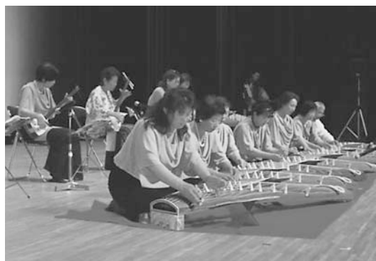
▲ 「琴・三味線・十七絃」の教室

開講式、第2部の「成果発表会」では第3期塾生さんの「学習成果」が披露されましたが、教室での「学習結果」を華やかな舞台上で発表する姿は、喜びと感動の笑顔で溢れていました。