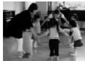
うたあそびリトミックの様子

“活かした使える英語を身につけたい”子どもたちによる英会話でのスピーチ。英語で自己表現できるための7つの力、度胸力・論理力・理解力・語彙力・応答力・プレゼン力・説得力を見て聴いて、実感して下さい!