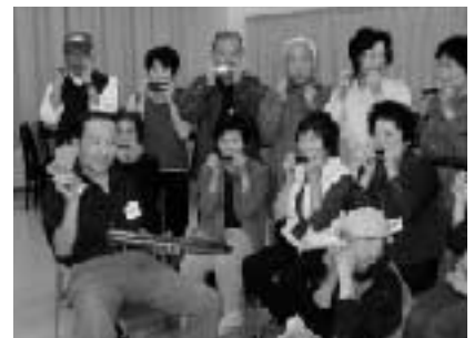
楽しいハーモニカ講座

〒314-0031鹿嶋市宮中 4631-1 まちづくり市民センター内かしま灘楽習塾事務局 TEL85-2601/ FAX 85-2602 E-mail: kashimanada_info@yahoo.co.jp HP: http://www.geocities.jp/kashimanada_info