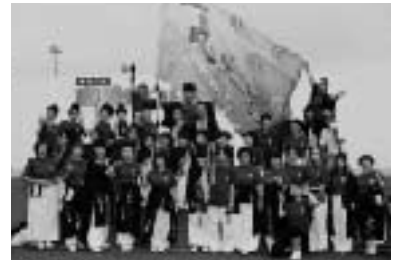
よさこいソーラン