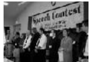
昨年のスピーチコンテスト

その他、乳幼児と親御さんで楽しめる『ママキッズ英会話』子育てママにおススメの『育自カフェ』も大人気。ブログをご覧ください!