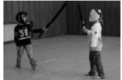
スポーツチャンバラ