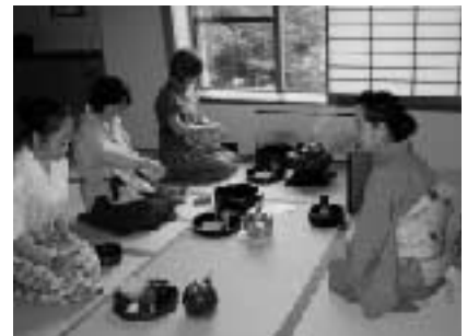
お茶を楽しむためのマナー教室講座

その他 講座受講の決定については、3月 15日(火)までに担当教授から連絡します。