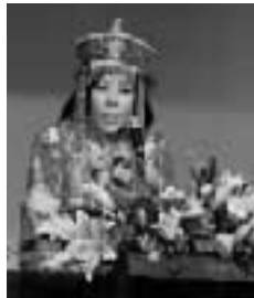
▲昨年のコンテストの様子