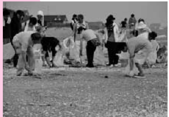
▲浜津賀海岸の様子