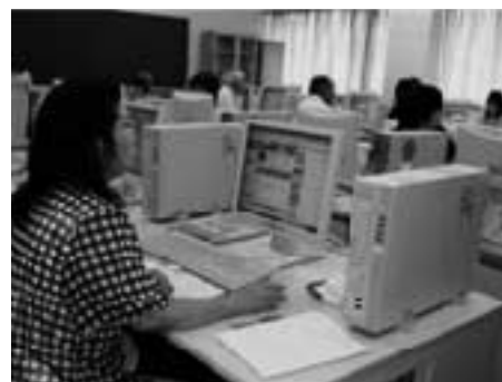
▲パソコン教室の学習風景

〒314-0006 茨城県鹿嶋市宮中4631-1 鹿嶋市まちづくり市民センター内 TEL 85-2601 FAX 85-2602 ※火曜日から金曜日までのお昼休みを除く9:00～16:00> Eメール kashimanada_info@yahoo.co.jp ホームページ http://www.geocities.jp/kashimanada_info