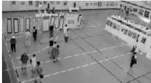
▲美術展会場の様子