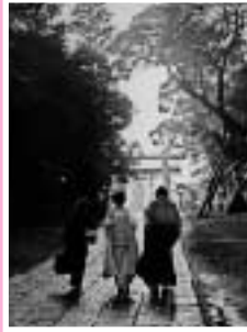
写真の部・渡辺保男