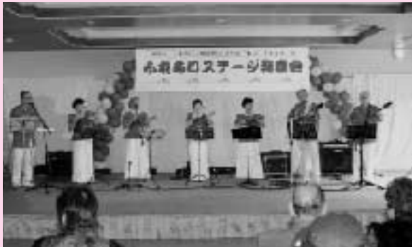
▲昨年度ステージ発表の様子

主催：鹿嶋市 主管：第5回て〜ら祭実行委員会 問合せ：まちづくり市民センター TEL 83-1551