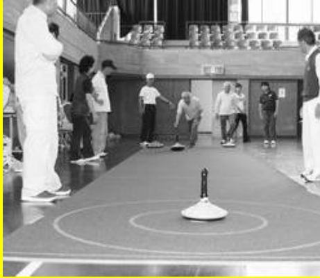
▲誰でも気軽に出来るユニカール

かしまスポーツクラブでは、9月24日(土)に創立10周年記念イベントとして“KSCまつり”を開催いたしました。午前の部ではユニカールやスポーツチャンバラなどの各種スポーツ体験が行われ、午後の部ではヨーヨーすくい・焼きそば・豚汁・かき氷などの模擬店が出店されました。当日は天候にも恵まれ、多くの方が来場され大変賑わいました。今後もかしまスポーツクラブは様々なイベントを計画していますので、みなさんのご参加をお待ちしております。