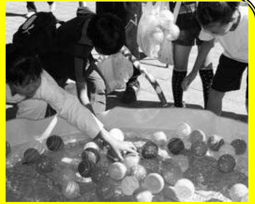
▲子どもに大人気ヨーヨーすくい

かしま環境ネットワークでは、10月15日(土)・16日(日)に開催された「かしま祭り」、11月5日(土)・6日(日)に開催された「て～ら祭」に出展しました。1年間の活動報告や各プロジェクトの紹介などをパネル展示しました。体験コーナーでは新聞紙でエコバッグを作成したり、チラシで小物入れなどを作成しました。身近なものの再利用方法を多くの方に知っていただく良い機会となりました。