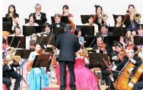
▲定期演奏会の様子

問合せ カシマフィルハーモニー TEL 090-9649-1551 E-mail kpo-music@magic.odn.ne.jp