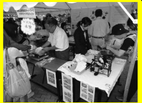
▲「て～ら祭」模擬店の出店