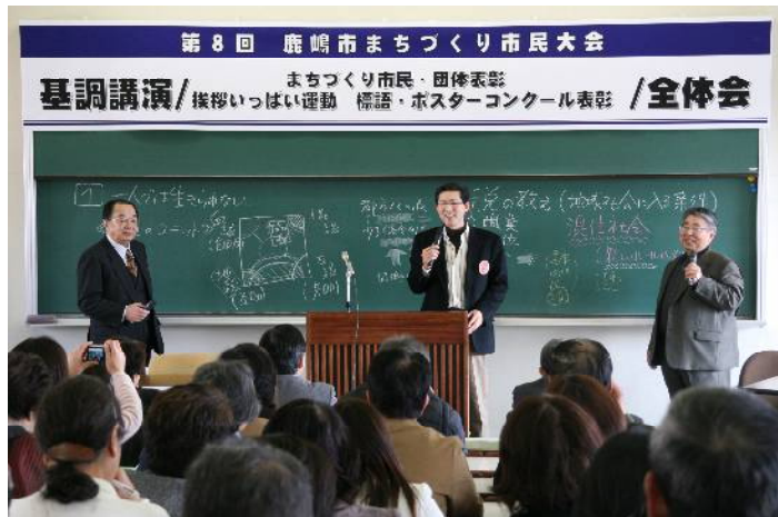
▲昨年度のまちづくり市民大会の様子

平成23年度の大会は「元気いっぱい交流（ふれあい）のまち鹿嶋をめざして～地域防災を支える市民活動～」をテーマに、小学校区別防災計画（案）・マニュアル（案）の発表とシンポジウムを行います。