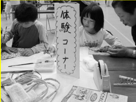
▲「かしま祭り」の体験コーナー

かしま環境ネットワークでは、10月15日(土)・16日(日)に開催された「かしま祭り」、11月5日(土)・6日(日)に開催された「て～ら祭」に出展しました。1年間の活動報告や各プロジェクトの紹介などをパネル展示しました。体験コーナーでは新聞紙でエコバッグを作成したり、チラシで小物入れなどを作成しました。身近なものの再利用方法を多くの方に知っていただく良い機会となりました。