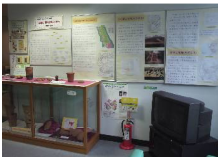
▲特別移動展の様子