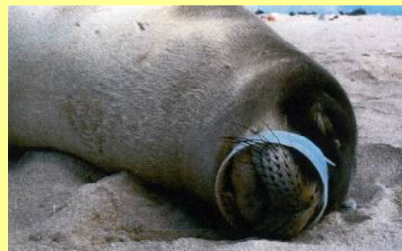
▲ゴミが口にはまったアザラシ

海洋の生態系を破壊するなど、海ゴミは国際的な問題になっています。海岸のクリーンアップについて考えてみませんか。