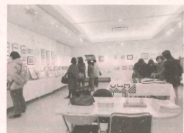
▲多くの来場者で賑わった会場

1月31日(火)~2月26日(日)にまちづくり市民センターにおいて、第一文芸学部20講座が主になって「かしま灘楽習塾作品展示会」が行われました。多くの方に来場していただき、学習成果を発表する機会となりました。