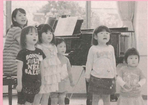
▲小さなお友達による発表会

ニューライフカシマ21では親子で参加できる「うたあそびリトミック」を開催しています。小さなお子さんでも歌う事を通じて、表現する喜びを体験できます。ピアノなどの楽器を始める前のステップとしてもお勧めです。