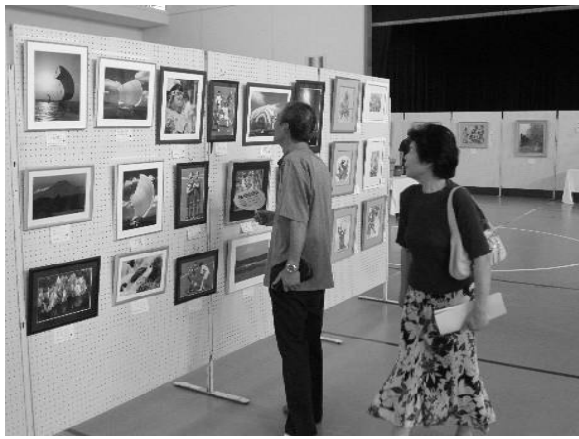
▲昨年度の会場の様子

絵画や陶芸など、日頃さまざまな創作活動を行っている市民の方々の作品を公募し、展示する事でより一層の創作意欲の向上と芸術文化の啓発・普及を目的として行われる展覧会です。