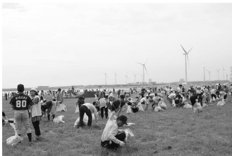
▲昨年の平井海岸の様子