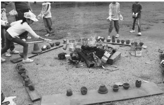
▲昨年度の焼成の様子

古代人と同じ方法による、土器づくりに挑戦してみませんか？縄などで模様をつけて作った土器は1ヶ月ほど乾燥させた後に野焼きを行い焼成します。土器に触れて教科書からは学ぶことのできない経験をしましょう。