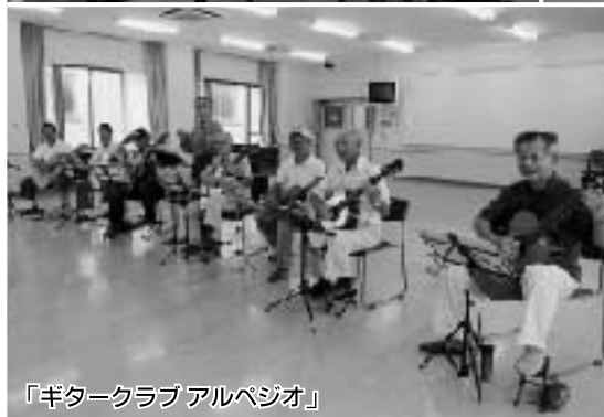
「ギタークラブアルベジオ」