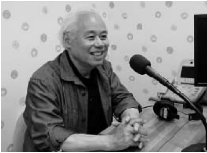
▲FMかしまの放送スタジオにて。自らが放送を担当する番組「ナハト・ムジーク」は開局当初から続く長寿番組となっている

「市民第九交響曲コンサート」音楽総監督 エフエムかしま市民放送(株)代表取締役社長