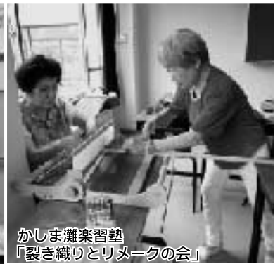
かしま灘楽習塾 「裂き織りとリメイクの会」