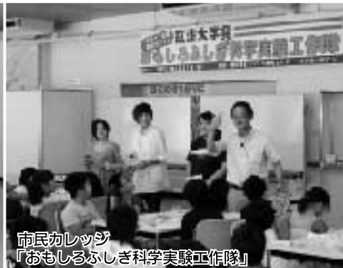
市民カレッジ 「おもしろふしぎ科学実験工作隊」