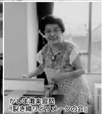
かしま灘楽習塾 「裂き織りとリメイクの会」