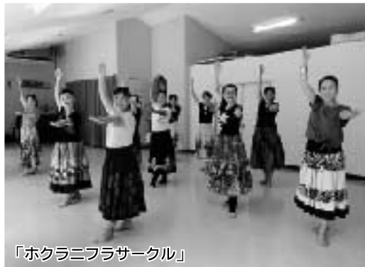
「ホクラニフラサークル」