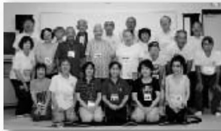
▲鉢形はつらつ体操教室の参加者の皆さん (8月5日、鉢形まちづくりセンターにて)