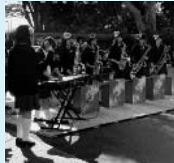
▲昨年の屋外ステージから

まちづくり市民センターに集う人たちの「出会いと絆」づくりと、日頃の活動の成果を発表して、つどい・学び・つくる喜びを共有することを目的に開催します。