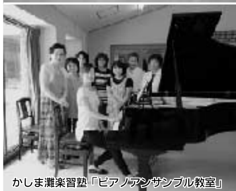
かしま灘楽習塾「ピアノアンサンブル教室」