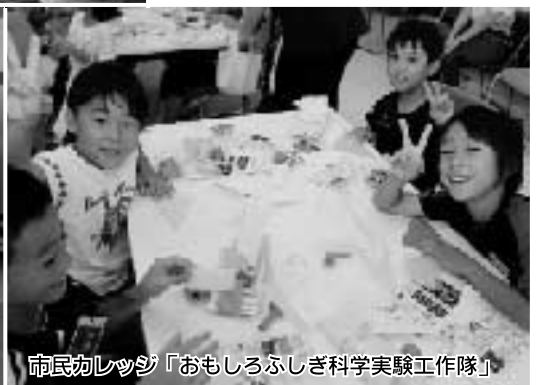
市民カレッジ「おもしろふしぎ科学実験工作隊」