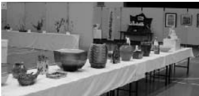
▲昨年度の展示会場の様子