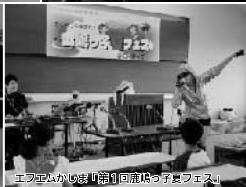
エフエムかしま「第1回鹿嶋っ子夏フェス」