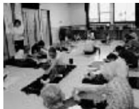
▲参加者全員で声を出してカウントしながら体操します