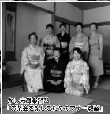
かしま灘楽習塾 「お茶会を楽しむためのマナー教室」