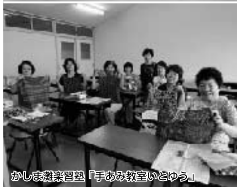
かしま灘楽習塾「手あみ教室いどゆう」