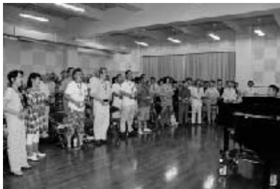
▲発声練習に励む参加者の皆さん（鹿嶋勤労文化会館にて）

10分の短い番組でも、企業からぜひスポンサーにとのお話をいただくことがあります。話が面白く心地よく聞けても、やはり中身がない番組ばかりでは経営はできません。しっかりと“蓄電”できるように、文化・教育面に力を入れた番組を作っていきたいと思っています。