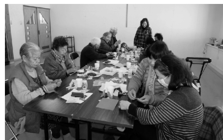
大人にも人気の折り紙で、指先を使って脳トレ。集中力もアップします。 「でんえん」/豊津公民館ふれあいサロン