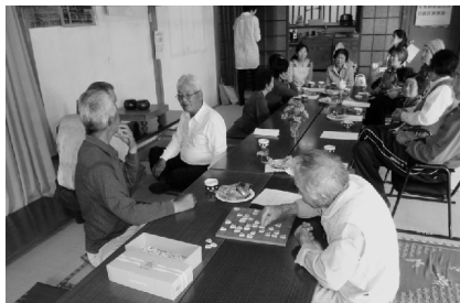
将棋を指すグループ、おしゃべりするグループ、行動は別々でもグループ間の情報交換は欠かせません。「お茶っ子桜」/大船津新田公会堂