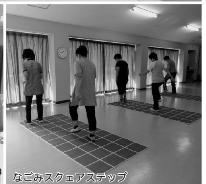
なごみスクエアステップ