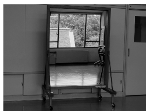
キャスター付の鏡