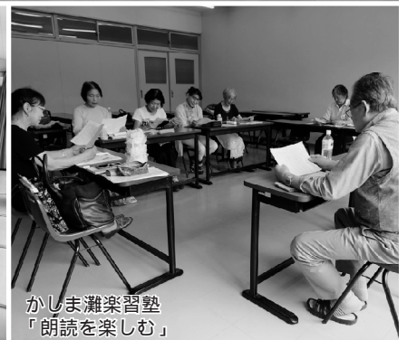
かしま灘楽習塾 「朗読を楽しむ」