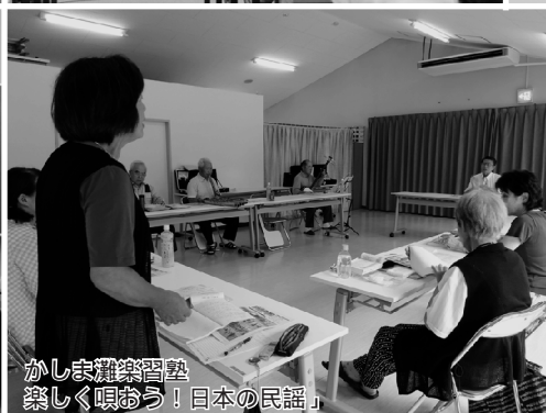
かしま灘楽習塾 「楽しく唄おう!日本の民謡」