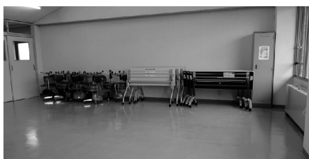
イスとテーブルは常時教室後部に設置

施設名は研修室ですが、B棟2階の“創作室”とほぼ同じように使える部屋です。弦楽器(ギター・琴・三味線・二胡)ハーマモニカなどの比較的音の小さな楽器の練習や、フラダンス・フォークダンス・日舞などのダンス系の練習に適しています。会議には最大で20人分のイスとテーブルの利用が可能です。