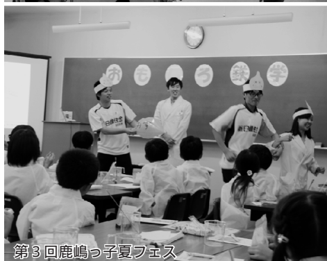
第3回鹿嶋っ子夏フェス