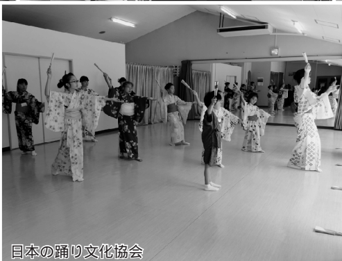
日本の踊り文化協会