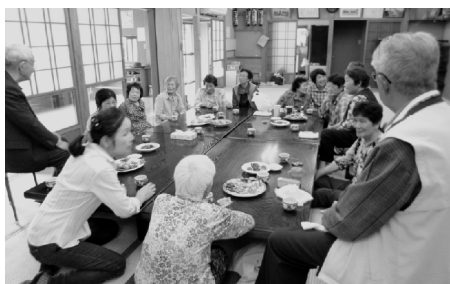
こちらも和やかにお茶会。今日の話題なんでしょう? 「サロン和」/大船津公会堂