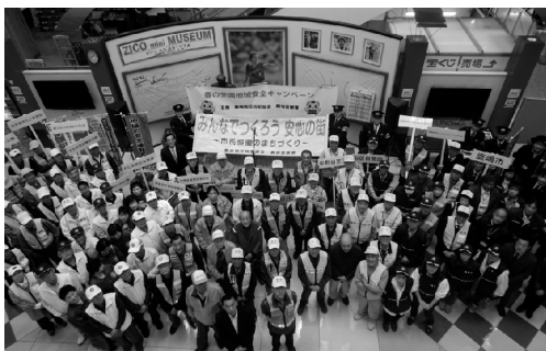
平成29年春 地域安全キャンペーンから