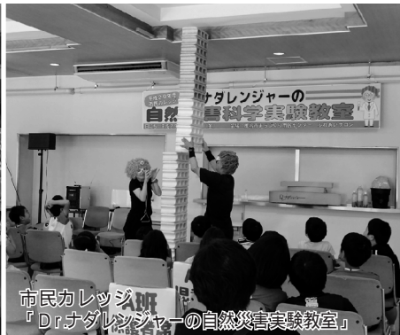
市民カレッジ 「Dr.ナダレンジャーの自然災害実験教室」