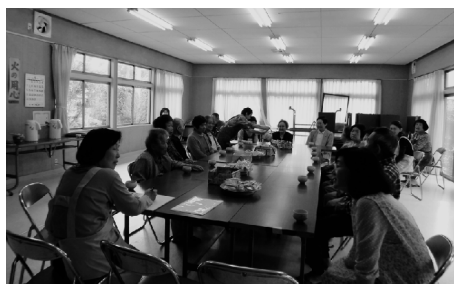
テーブルを囲んでお茶をしながら歓談中。ゆったりと楽しい時間が流れます。 「サロンお茶っ子」/爪木田園都市センター

地区によってはやや男性の参加が少ないとの課題もありますが、さらに工夫と魅力を加えて豊津地区「地域サロン」の賑わいを目指しています。