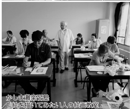
かしま灘楽習塾 「絵を描いてみたい人の絵画教室」