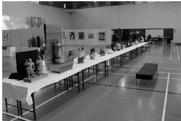
昨年度の展示会場の様子