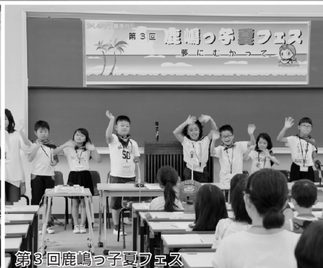
第3回鹿嶋っ子夏フェス