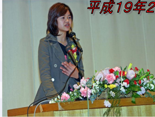
▲昨年のスピーチの様子

日時:平成19年2月18日(日) 13:00 ~ 15:30 場所:鹿嶋勤労文化会館大ホール ※入場無料