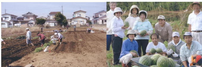
< ふれあい菜園での農作業風景 >

市内には野菜栽培に適した畑地が遊休地の形で多くあり、それらを有効に利用し、“新鮮で美味しい野菜作りを体験しながら市民同士が気軽に交流しよう”とするものです。又、専門家を招いて農地利用研究も兼ねた農作業のノウハウも学んでいます。