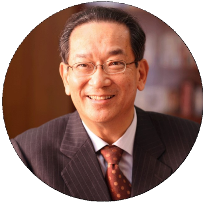
きたがわ まさやす 北川 正恭 氏