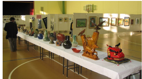
▲昨年の芸術祭の様子