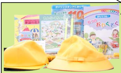
▲寄贈していただいた品々