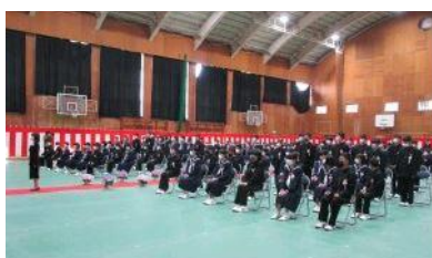
△平井中学校の入学式の様子