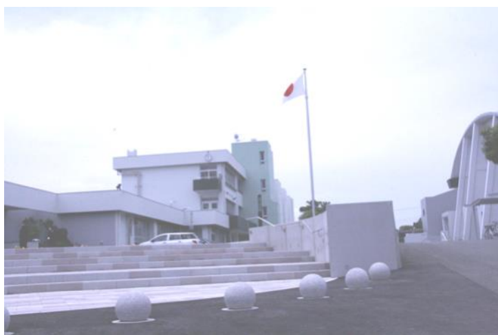
△高松小中学校校舎

高松中学校校舎の大規模改造工事が終了し、校舎や体育館が一新、中庭には遊具が新設されました。令和5年4月よりリニューアルした校舎にて、新たなステップアップの一貫教育（施設一体型一貫教育）が始まったことで、更に密度の高い教育が期待されるところです。