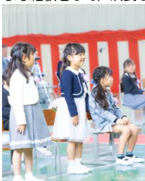
△鉢形小学校の入学式の様子

この6年（3年）間の学びの中で子どもたちがさまざまな経験をして、成長していくのが楽しみです。