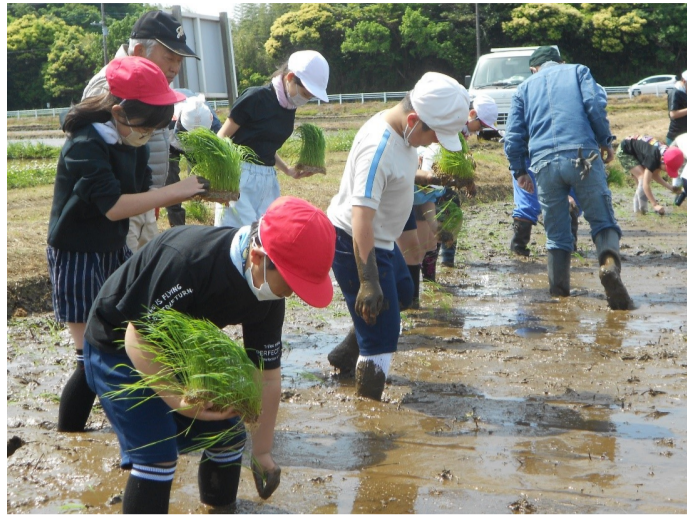
▲田植え体験 たくさんとれるといいね！

5月9日（火）鉢形小学校5年生の児童を対象に、地域の方々の指導のもと、『鉢形子ども米づくり事業 田植え体験』を実施しました。子ども達は、泥だらけになりながらとても楽しそうに田植え体験をしていました！