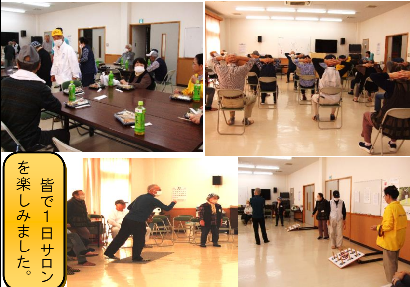
皆で1日サロンを楽しみました。

今回のサロンは、感染症対策を行いながらの行事となった事から終了時間を1時間程繰り上げて正午頃には終了することができました。ご協力ありがとうございました。