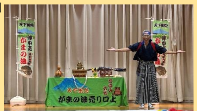
チーム鹿行「がまの油売り口上」