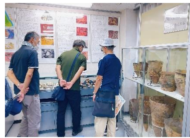
どきどきセンターにて

鹿嶋の古代を探るべく参加者21名が粟生のどきどきセンターを訪れました。館内は氷河時代から江戸時代までの土器や石器などが多く展示されていました。市バスで移動し、奈良・平安以降とされる国史跡鹿嶋神宮境内附郡家跡、宮中野古墳群最大規模とされる夫婦塚古墳を見学しました。