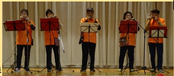
赤とんぼ「ハーモニカ演奏♪」