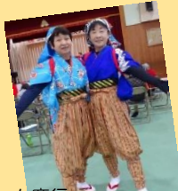
チーム鹿行 南京玉すだれを披露！

模擬店・ステージ発表・作品展・ワークショップなど盛りだくさん♡ 雨の中でしたが、たくさんの方が遊びに来てくれました！