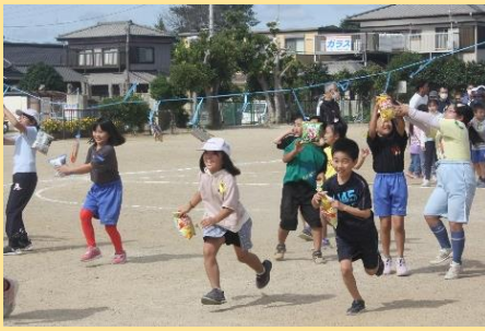
早い者勝ち！！お菓子・パンをゲットだぜ♪