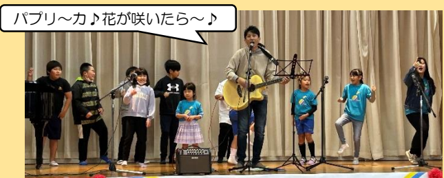
パブリ〜カ♪花が咲いたら〜♪