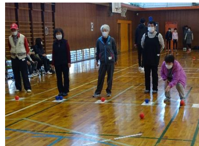
上位を目指して投球