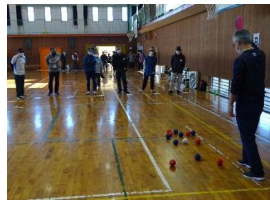
審判の判定もバッチリ

三笠小体育館にて36名(12チーム)が参加し腕を競い合いました。4ブロックに分かれリーグ戦にて行われました。上位4チームが1月20日に以前の中央大会(ソフトバレー)に変わって行われる鹿嶋市地区対抗球技大会に出場します。(H)