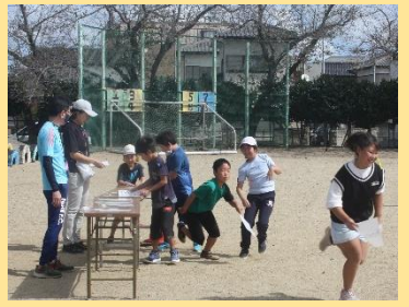
ちょっと拝借！借り物競争！