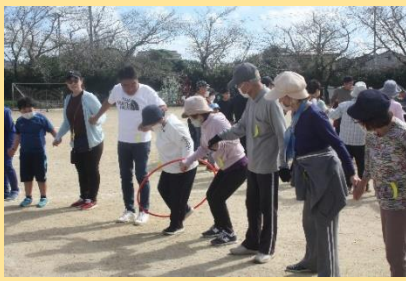
チーム対抗！フラフープリレー！