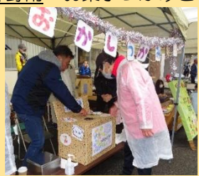
神野附「お菓子つかみどり」