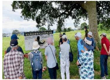
くにしせきかしまじんぐうけいだいつけたりくうけあと 国史跡鹿嶋神宮 境内 附郡家跡