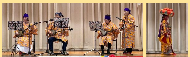
ユンタク会「三線」・「琉球舞踊」