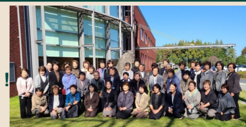
茨城県で活躍されている女性農業委員のみなさん 令和5年度いばらき農業委員会女性協議会現地研修会（令和5年11月8日）

※国が定める「第5次男女共同参画基本計画」では令和7年度までに農業委員の女性割合を30%にすることを目標としております。