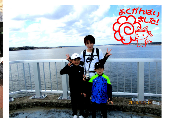
最年少5歳！ 33km完歩しました！