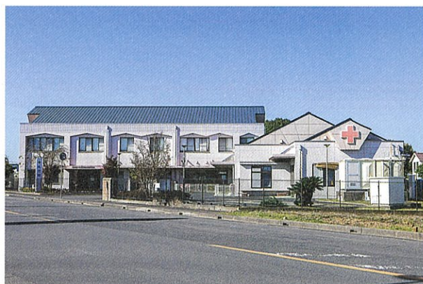
日本赤十字茨城県支部乳児院