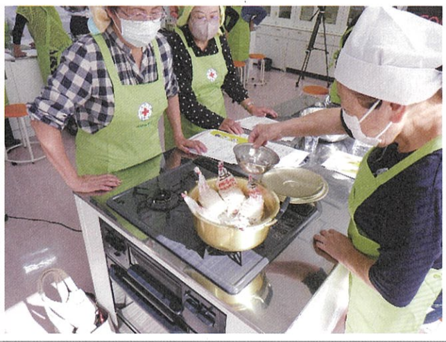
災害用炊飯袋を用いた炊き出し訓練

※2 厚生労働省が推進しているシステムで、団塊の世代が75歳以上となる2025年をめどに、重度な要介護状態となっても住み慣れた地域で自分らしい暮らしを人生の最後まで続けることができるよう、住まい・医療・介護・予防・生活支援が一体的に提供される社会システム。