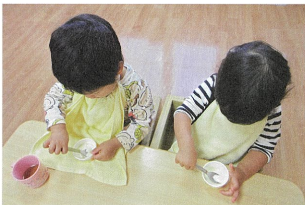
こぼしても大丈夫。たくさん食べて大きく育てね