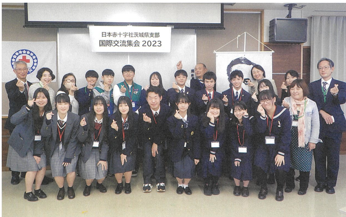
韓国の青少年赤十字（JRC）メンバーと国際親善

11月18日から22日までの5日間、大韓赤十字社(韓国)の青少年赤十字メンバー2名が当県を訪れ、青少年赤十字メンバーとの交流集会や、茨城高等学校と水戸桜ノ牧高等学校での1日体験学習に参加するとともに、青少年赤十字メンバー宅でのホームステイを行いました。