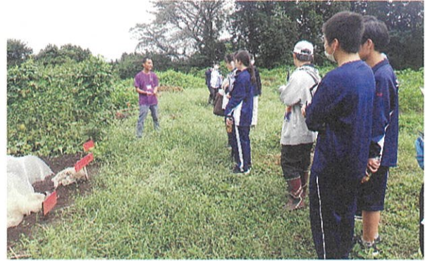
有機農業について説明を受ける

9月23日、北関東三県（茨城、栃木、群馬）支部合同の国際交流事業の一環として、各県の高校生メンバー27人と指導者5人（茨城からメンバー4人、指導者1人が参加）が栃木県那須塩原市にある「学校法人 アジア学院」を訪問しました。