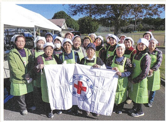
かすみがうら市地域奉仕団の皆さん

私たち奉仕団は、災害や有事の際に地域内で助け合う活動をしております。市の総合防災訓練を前に日赤茨城県支部の職員にご支援をいただき災害用炊飯袋を使用した非常食の手順を再確認しました。防災訓練当日も手際よく奉仕団一人ひとりが役割を理解し実施することができました。人と人との交流が戻ってきましたので、これからも他団体と連携を図りながら地域ニーズに応じた活動に取り組んでまいります。