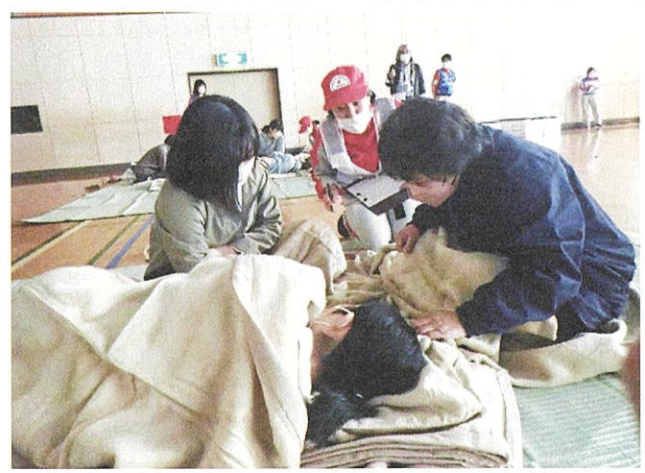
体調が悪い方への聞き取り