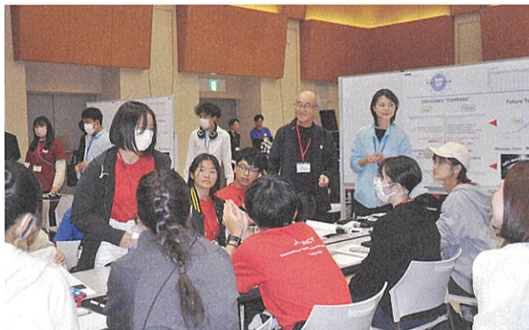
気候変動についてディスカッションするメンバー