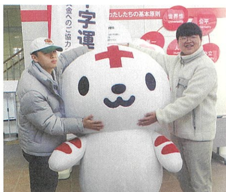
韓国メンバーとハートラちゃん