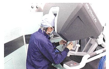
遠隔操作する医師