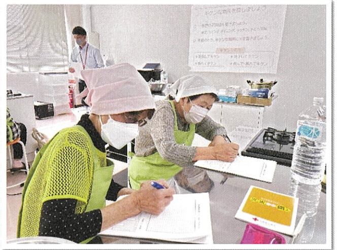
自宅内の危険な場所を確認