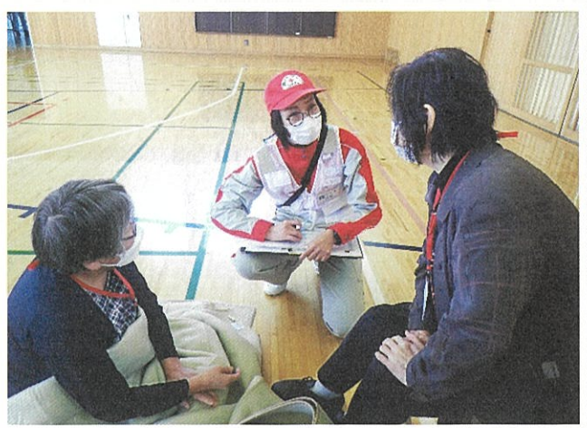
避難者への声かけ