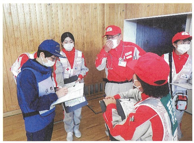
避難所の保健師との情報共有