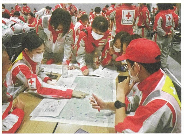
避難所までのアクセス確認

茨城県支部では、本県内で実際に災害が発生した時に、迅速かつ適切な救護活動が行えるよう、定期的に訓練を行っているほか医療資機材の整備も進めています。