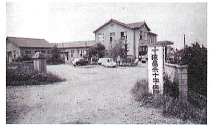
創設当時の古河(猿島)赤十字病院 昭和28年