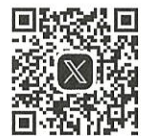
つくば献血ルーム公式SNS