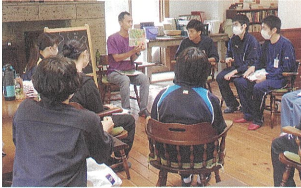
学院のスタッフから海外の文化を学ぶ