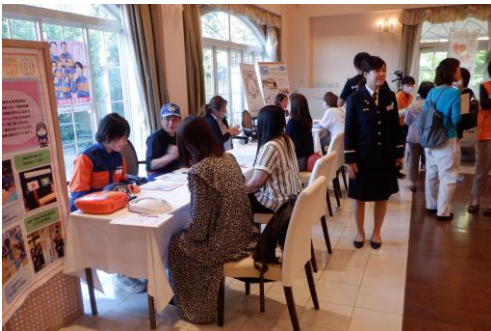
△ 第3部フリータイムの様子

企業8社、4団体、個人事業主3社、3官公庁の計19事業者が出店し、参加者からの業務内容などについての質問に応じました。