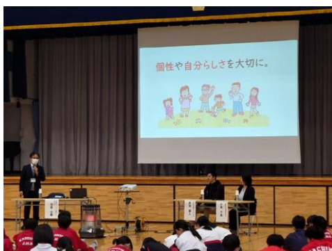
△コーディネーターによるまとめ

・経験した仕事は次の仕事にも活かすことができるということを知り、将来に活かしていければいいなと思いました。