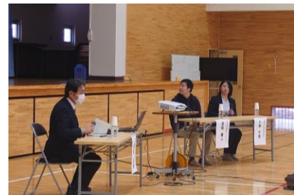
△ゲストティーチャーへのインタビュー

将来、自分らしく充実した人生を送るため、性差や固定観念によらない職業選択について学ぶ授業を、茨城県ダイバーシティ推進センター「ぼらりす」と実施しました。