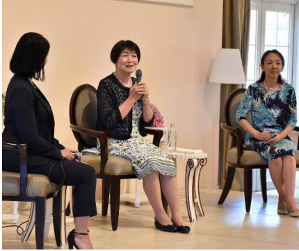
△ 第1部トークセッションの様子