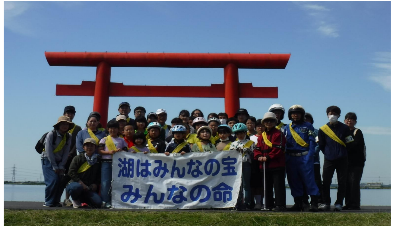
第41回北浦サイクリング