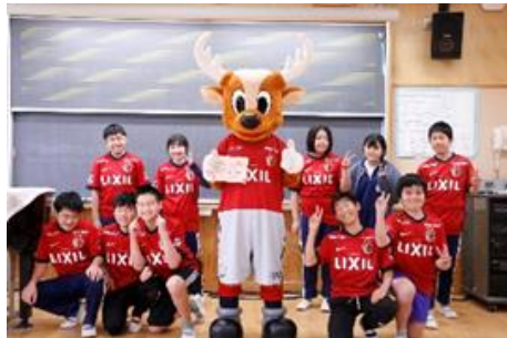
↑しかおくんとの写真(平井小)