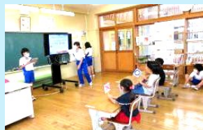
←クイズ大会 (小1と小6)