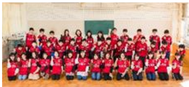
↑ユニフォームを着用しての集合写真(中野東小)

そのお礼として、平井小学校では6年生が応援のメッセージ動画のDVDを作成し、3月18日(金)にアントラーズのマスコットキャラクターの「しかおくん」に贈りました。