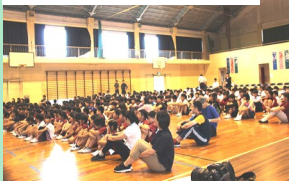
小中合同人権フォーラム

令和4年度は高松中学校で大規模改造工事を行っており、高松小学校で小学生と中学生が一緒に生活しています。令和5年度からは、中学校の校舎で児童生徒が授業を受ける施設一体型小中一貫教育となります。