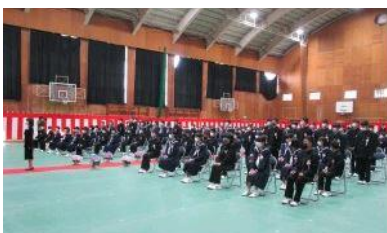
△平井中学校の入学式の様子