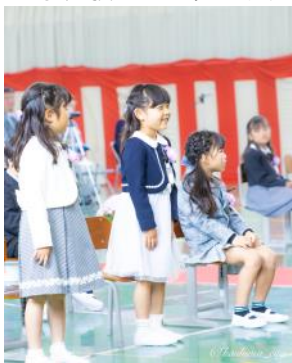
△鉢形小学校の入学式の様子

この6年（3年）間の学びの中で子どもたちがさまざまな経験をして、成長していくのが楽しみです。