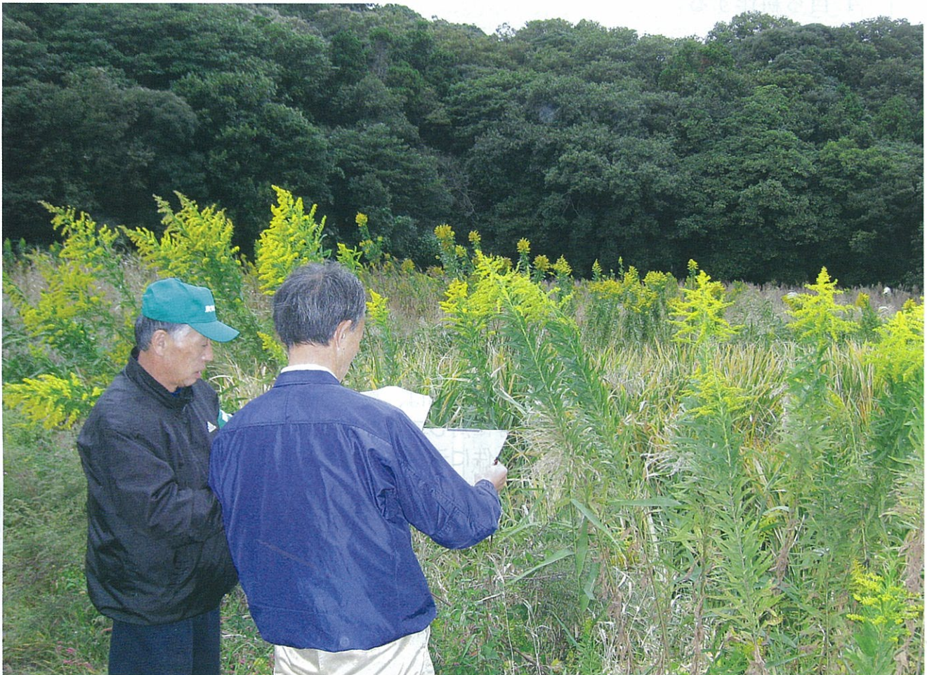
(鉢形地内の利用状況調査の様子)

E-mail : nouil@city.ibaraki-kashima.lg.jp