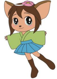
鹿嶋市公認マスコットキャラクター ナスカちゃん

※鹿嶋市個人情報保護条例（平成15年鹿嶋市条例1号）の規定の趣旨に基づき申込みされた個人情報は本事業の目的以外に利用いたしません。