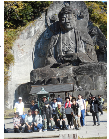
石仏では日本一の太仏

創立130年以上になる歴史を持つ、祖父母も通った我が母校豊津小も、令和10年に鹿島小への統合が決定。廃校後は保田小同様に校舎の有効利用を図って、後世に残る施設になることを願っています。